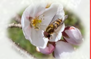
動物や植物との共生