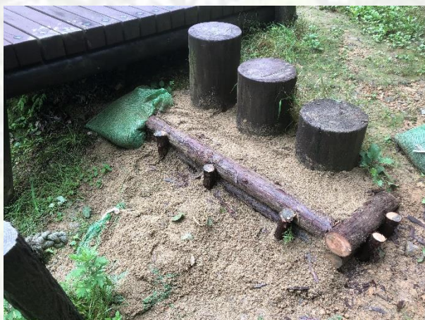
階段補修などに利用