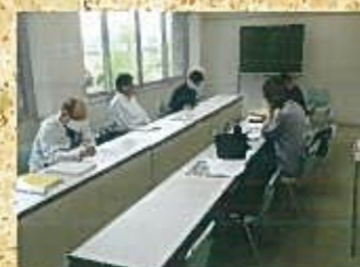
市民参加の円卓会議