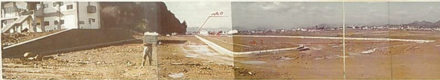
北駐車場整備の様子 左端の建物は現在の公園事務所（1974年）