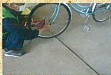
安全利用のための日常点検