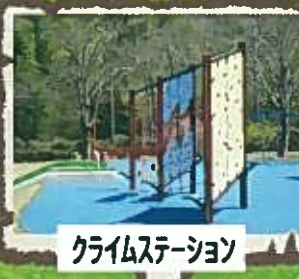
クライムステーション