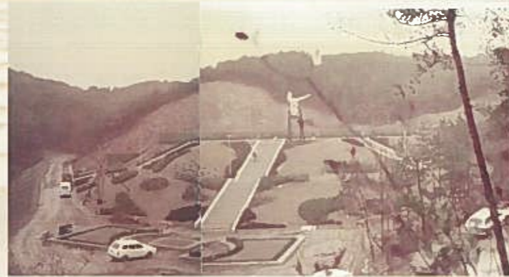
噴水広場周辺整備の様子 奥に真新しい百寿の塔（1975年）

岐阜県百年公園は、ご利用いただく皆さんに、里山の中で忘れかけていた日常の里山文化の魅力を再発見していただきながら、安全で安心してご利用頂ける公園、憩いの場として快適にすごしていただける公園を目指した取組を始め、公園資源の保護、環境保全など持続可能な開発目標（SDGs）にも取り組んでいます。