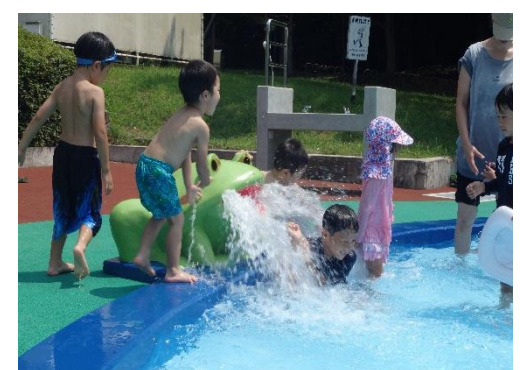
子供たちでも安全に利用できる公園