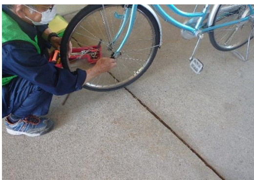
安全にご利用いただくための日常点検