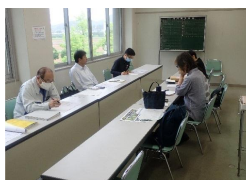
市民参加の円卓会議