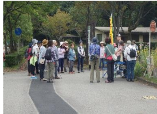
公園資源を保護する活動