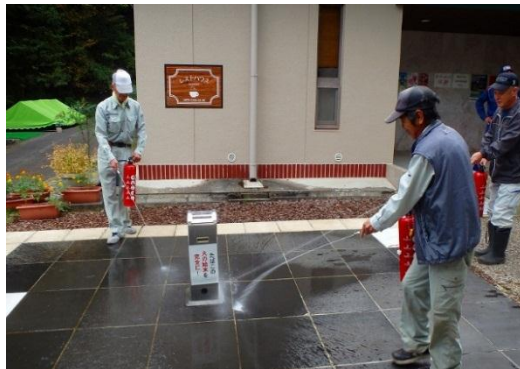
災害に強い公園を目指した日々の訓練