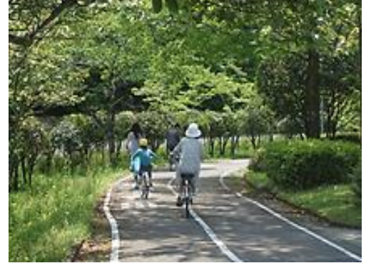
誰もが健康であり続けるために